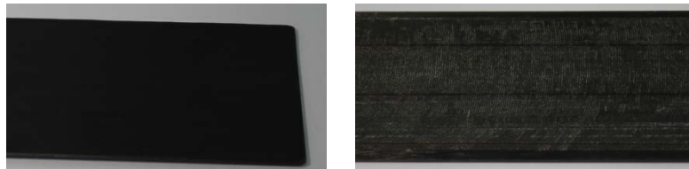
Figura 1: A sinistra lamina pultrusa senza peel play mentre a destra con peel play